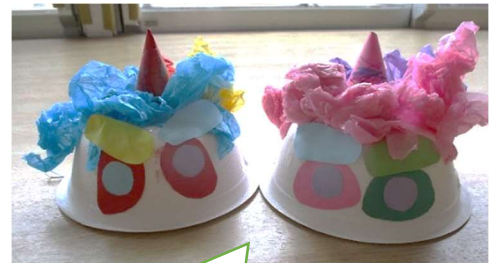
みんなで作った鬼の帽子