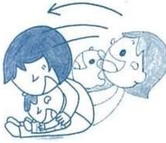
後ろへ反動をつけて 「わー」と言って体を前に倒す