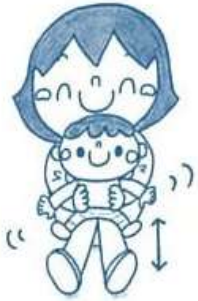
子どもを膝の上に乗せて リズムに乗る