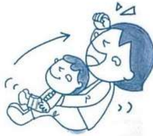
ゆっくり体を後ろへ反らす