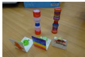
← 乳児のおもちゃ マラカス カスターネット

おまつりまで、みんなに楽しんでもらえるかドキドキしながらいろいろな準備を進めていき、当日は他の子どもたちの楽しんでいる姿を見て、ぞう組の一人一人が幸福感、達成感を感じてもらえたら嬉しいです。