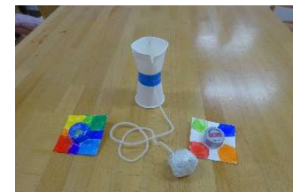
幼児のおもちゃ こま けんだま