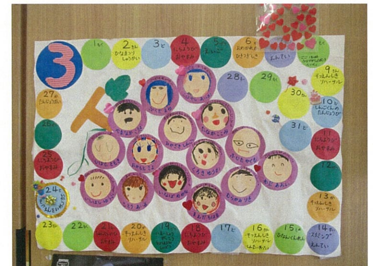
お願いごとボード