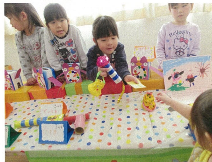
お店屋さんごっこ