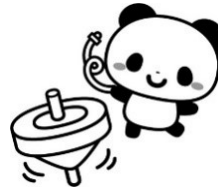
粘土遊びを始めました

子どもたち同士で楽しく会話をしながら遊ぶ姿が多く見られるようになってきました。友だちが困っていたり、泣いていたりと、優しく声を掛けて助けてくれる子もいます。「〇〇ちゃん(くん) いっしょにあそぼう」と誘っている姿がとても可愛らしいです。まだ玩具や座る席の取り合いなどトラブルもあるので子ども一人一人に寄り添いながら気を付けて見ていきたいです。